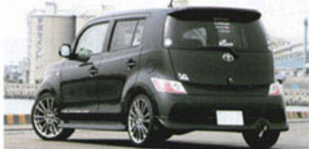
New bB用シートカバーがリリース