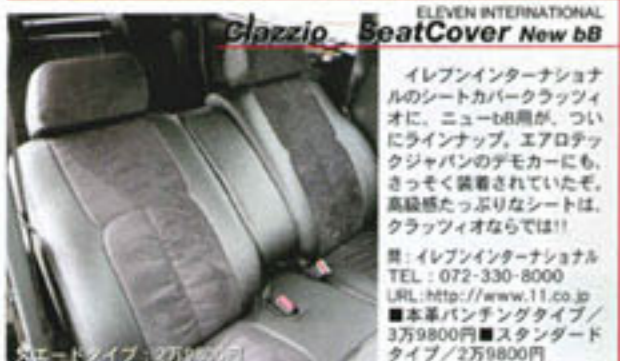
Clazzie BoatCover New bB